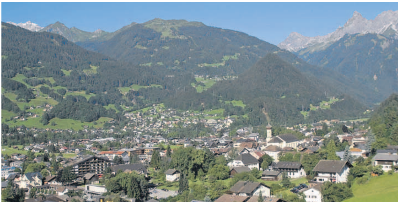
Gemeinden – wie auf dem Foto Schruns und Taschagguns (Hintergrund) – können über die Grundsteuer ihre Einnahmen regulieren.

Wie Aiginger betont auch Sonderegger, dass die Budgetsanierung in erster Linie ausgabenseitig erfolgen sollte. Steuererhöhungen soll-