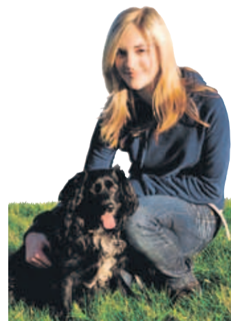
Die Hundesteuer regelt jede Gemeinde für sich.

9 Vergnügungssteuer: Für Spielapparate, Tanzveranstaltungen ohne „lebende Musik“, Stripteasevorführungen und „der Volksbelustigung dienende Anlagen“ (etwa Karussells oder Riesenräder), sind Steuern zu zahlen. VN-IB